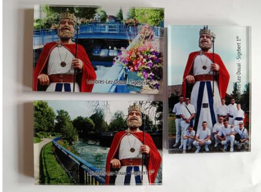
Magnet Sigebert Création originale MJC Lambres-lez-Douai Magnet rectangulaire photo 3 modèles existants Achat et revente au même prix d'un produit existant, en faible quantité, afin d'étoffer la boutique.