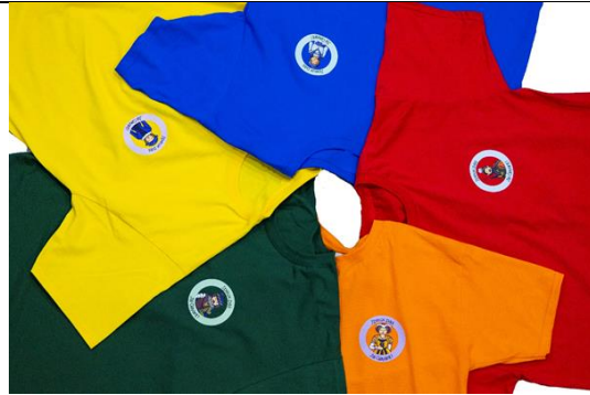
T-shirts 2024 T-shirts originaux créés chaque année à l'occasion des Fêtes de Gayant Adulte et enfants, 5 modèles différents