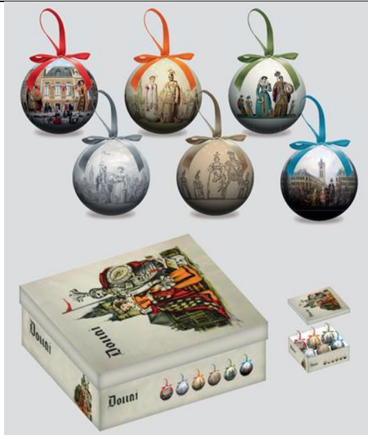
Coffret de 6 boules de Noël (visuel non définitif) Coffret personnalisé de 6 boules