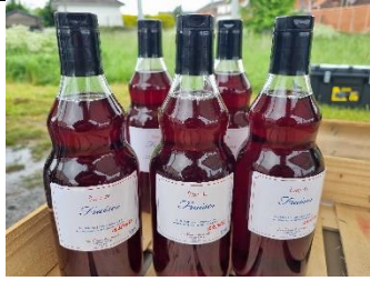
Confiture et sirop de fraises Les fraises du Moulin à Râches