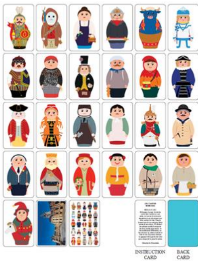
Jeu de memory Géants du Douaisis

Jeu de 54 cartes reprenant 25 géants du Douaisis